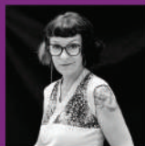
CORINNE MOREL DARLEUX